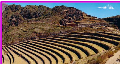
Agricultura en terrazas en las ruinas de Pisac, Perú.

Una de las áreas en donde todas las civilizaciones prehispánicas generaron un gran desarrollo fue la agricultura. Muchas de estas técnicas, como las terrazas de cultivo incaicas, las milpas mayas o las chinampas aztecas, siguen utilizándose hoy de forma similar a como se hacía hace miles de años atrás. Incluso los gobiernos de distintos países, así como organismos internacionales como la FAO (Organización de las Naciones Unidas para la Alimentación y la Agricultura) se han propuesto a recuperar estos conocimientos como parte de sus políticas de desarrollo sustentable.