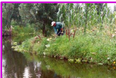
Chinampas en Xochimilco, México.