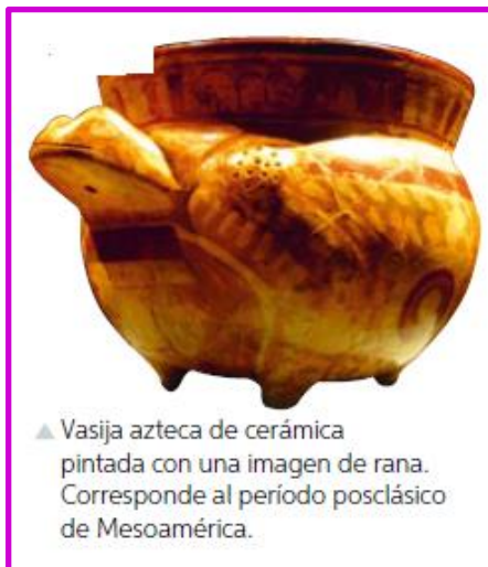
▲ Vasija azteca de cerámica pintada con una imagen de rana. Corresponde al período posclásico de Mesoamérica.