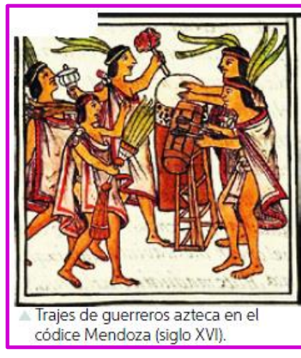
▲ Trajes de guerreros azteca en el códice Mendoza (siglo XVI).