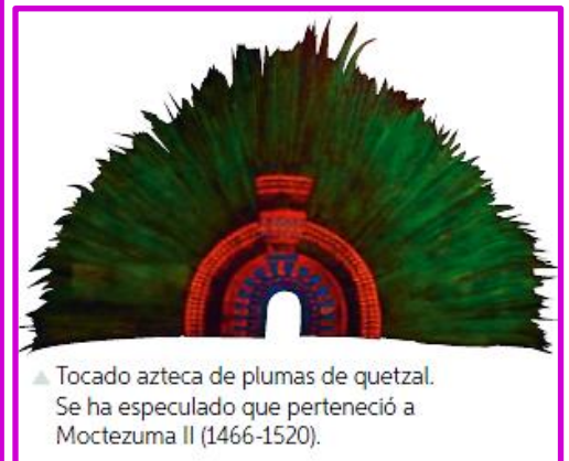
▲ Tocado azteca de plumas de quetzal. Se ha especulado que perteneció a Moctezuma II (1466-1520).