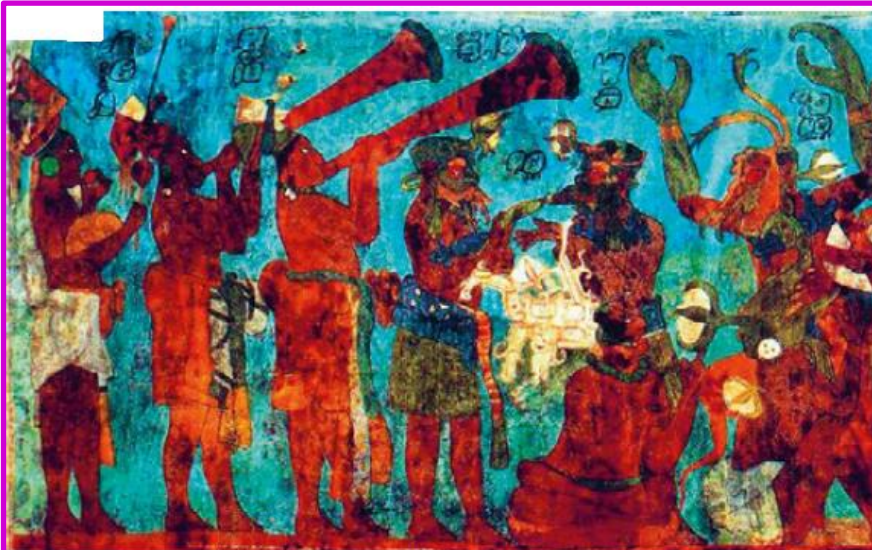
▲ Fragmento de uno de los murales mayas de Bonampak, México.