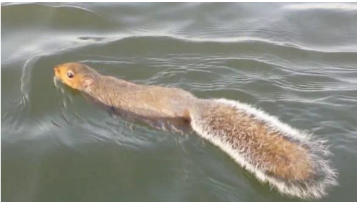
The squirrel can swim.