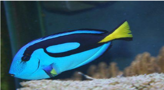
The fish can swim.