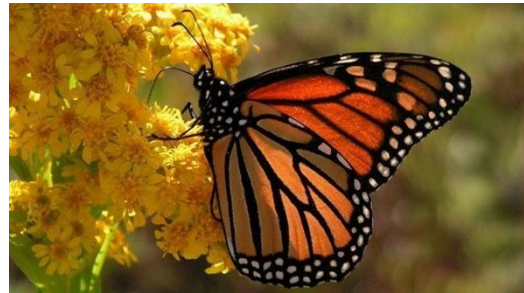
The butterfly can't run.