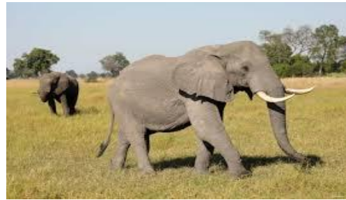
The elephant can't fly.