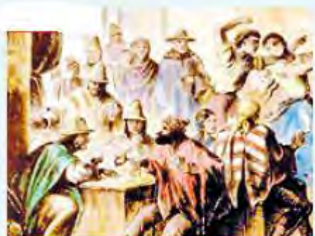
Chingana en Tres Puntas, de Paul Treutler, viajero alemán (1852).

◀ Las familias criollas acostumbraban reunirse en las casas para realizar tertulias, reuniones en las que los hombres conversaban sobre impuestos o la política de la Corona, mientras las mujeres bailaban y tocaban instrumentos musicales.