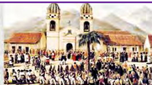
Andacollo. En Atlas de historia física y política de Chile, de Claudio Gay (1854).

El Cabildo era la institución encargada de organizar y financiar las grandes fiestas políticas y religiosas, las que se revestían, por ello, de un carácter oficial. Otras actividades propias de la sociedad colonial fueron los paseos al aire libre y la práctica