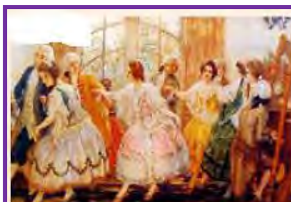
Baile del Santiago antiguo. Óleo de Pedro Subercaseaux (1917).

La vida colonial en Chile estuvo marcada por la influencia de la Iglesia católica, la religiosidad de sus fieles y por las diferencias sociales existentes entre los distintos grupos.