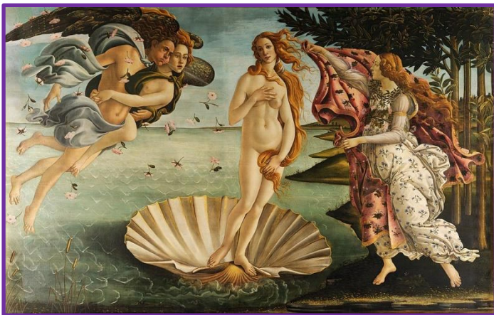
El nacimiento de la diosa venus o diosa del amor griega Afrodita.

Perseo con la cabeza de Medusa, obra creada en 1553 por Benvenuto Cellini (1500-1571), escultor, orfebre y escritor de Florencia.