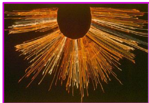
Quipu incaico de la época imperial (1300–1532).