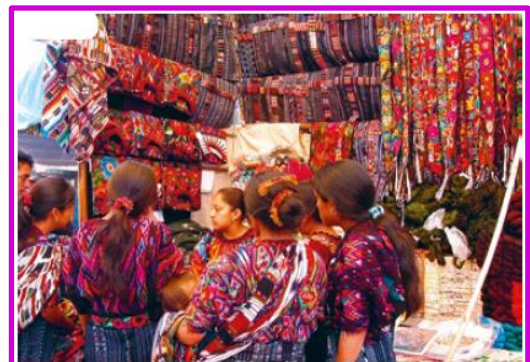
Mercado indígena guatemalteco en la actualidad

Durante muchos siglos convivieron en América una diversidad de pueblos con realidades y desarrollos históricos muy distintos: pueblos que se organizaban en bandas; otros que transitaron hacia una vida sedentaria y agrícola; y culturas que alcanzaron el estatus de civilizaciones complejas, como los mayas, aztecas e incas. Algunas culturas originarias conocieron la escritura, desarrollaron sistemas matemáticos, inventaron precisos calendarios, construyeron imponentes centros urbanos, en algunos casos, más grandes que muchas ciudades europeas, y aplicaron tecnologías para aprovechar mejor los suelos agrícolas. Muchas de estas manifestaciones culturales pueden apreciarse en la actualidad, no solo a través de los grandes monumentos y restos arqueológicos, sino también formando parte de las tradiciones y de la identidad de los países de nuestra América mestiza. Podemos apreciar manifestaciones lingüísticas, artísticas, agrícolas, medicinales y alimentarias, así como costumbres, creencias y saberes, que enriquecen a las sociedades americanas.