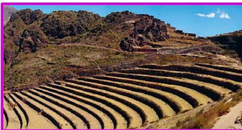
Agricultura en terrazas en las ruinas de Pisac, Perú.

Una de las áreas en donde todas las civilizaciones prehispánicas generaron un gran desarrollo fue la agricultura. Muchas de estas técnicas, como las terrazas de cultivo incaicas, las milpas mayas o las chinampas aztecas, siguen utilizándose hoy de forma similar a como se hacía hace miles de años atrás. Incluso los gobiernos de distintos países, así como organismos internacionales como la FAO (Organización de las Naciones Unidas para la Alimentación y la Agricultura) se han propuesto a recuperar estos conocimientos como parte de sus políticas de desarrollo sustentable.