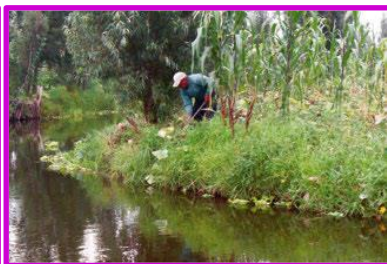
Chinampas en Xochimilco, México.