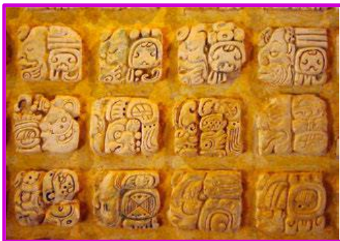
Jeroglifos mayas (siglo III a. C.), Palenque, México.