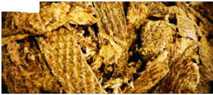
▲ Los incas desecaban y salaban la carne para hacer charqui, el que hoy se consume directamente o como parte de guisos, entre los que destacan el estofado y el charquicán.